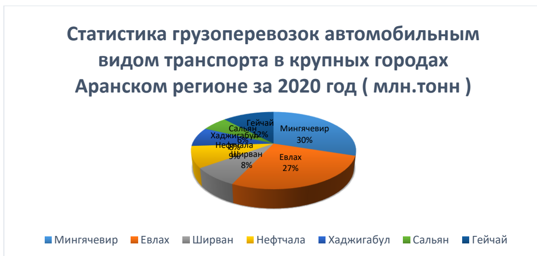
Рис. 3. Статистика грузоперевозок автомобильным видом транспорта в крупных городах Аранского региона за 2020 год (млн. тонн).

Через территорию этого района проходят транспортные линии, соединяющие Баку с основными экономическими районами, Грузией, Ираном и Турцией. В последнее время наблюдается тенденция увеличения количества международных перевозок, что повысило значимость этих транспортных путей. В районе действует аэропорт Евлах.