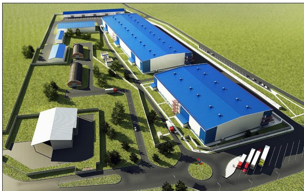
Рис. 1. Логистический центр

Развитую складскую инфраструктуру невозможно представить без логистического центра - места обработки материальных потоков. Логистический центр – это комплекс недвижимости, включающий участок со зданиями, оборудованный специальной техникой, предназначенный для оказания услуг по доставке товаров на оптимальных условиях. В первую очередь центры нужны транспортным организациям, компаниям, занимающимся транспортно-экспедиционной деятельностью, дистрибьюторам и производственным компаниям.